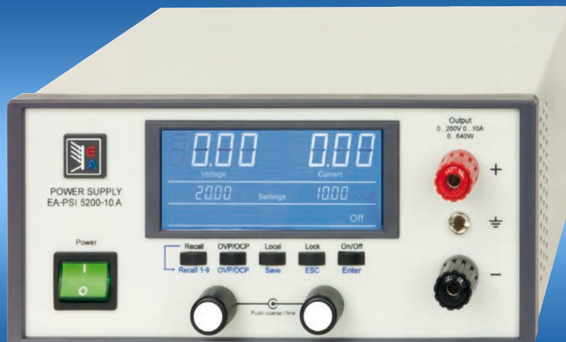
EA-PSI 5200-10 A

Программируемые настольные источники питания постоянного тока Programmable desktop DC Power supplies